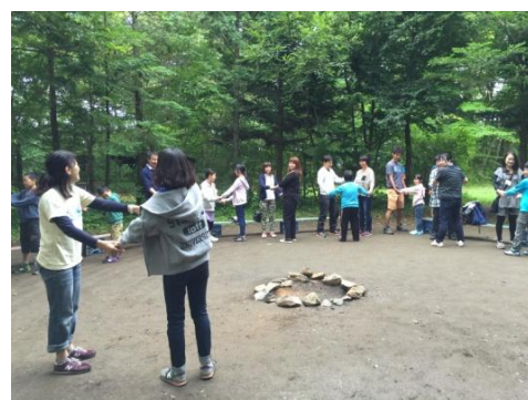
*フレンドシップキャンプ (のんびり親子リフレッシュキャンプ) の様子