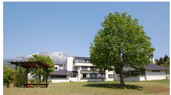
東京YMCA妙高高原ロッジは、国立公園内の森に囲まれた自然豊かなロッジです。温泉もお楽しみいただけます。

設備等：和室または 2 段ベッドルームを 1 家族（グループ） 1 室お使いいただけます。