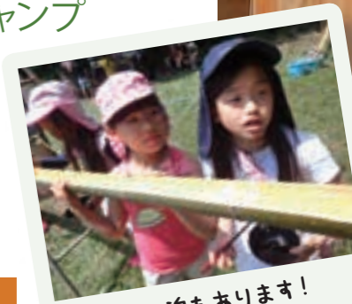
テント泊もあります!

東京からも3時間と比較的、近距離の赤城山のふもと、緑美しい赤城キャンプ場での3泊4日。そのうち1泊はテント泊体験を予定しています。赤城キャンプ名物のどろんこ遊びや竹を使った弓矢作りなどのクラフト(工作)、さらにはドラム缶風呂と山での生活を満喫します。また「キャンプソング」といわれる赤城キャンプ場ならではの歌も多く、キャンプサイトにはいつも素敵なハーモニーが響き渡ります。