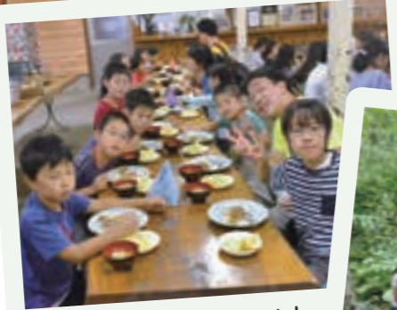
みんなていただきま～す!