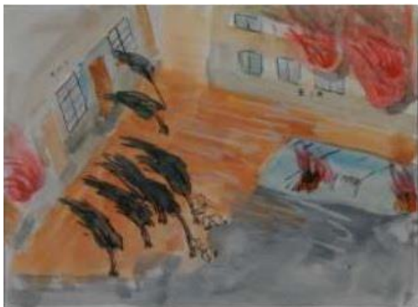
「燃える深川の畳工場」大塚萬夫画 (場所：江東区毛利)