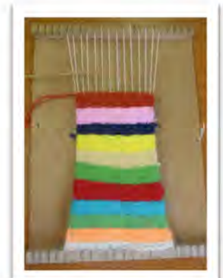
魔法のじゅうたん