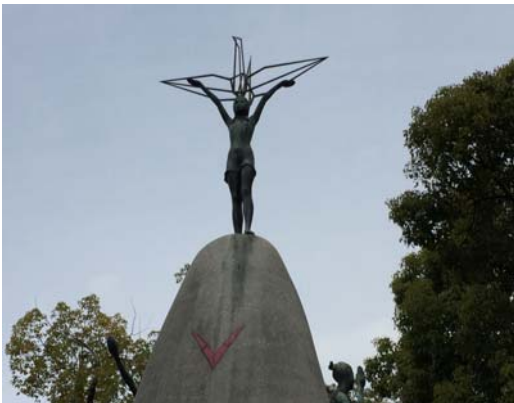
広島平和記念公園にある原爆の子の像(千羽鶴の塔)