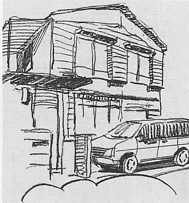
libyは温かいみんなの家

libyは温かいみんなの家。ここでは、評価の基準が異なります。背が低くても走るのが遅くても、発達に