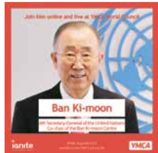
前国連事務総長・潘基文氏が基調講演。「ビジョン2030」への賛同と激励が贈られた(中面に記事有)