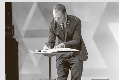
第20回世界大会では、「コンボYMCA」が新たに加盟