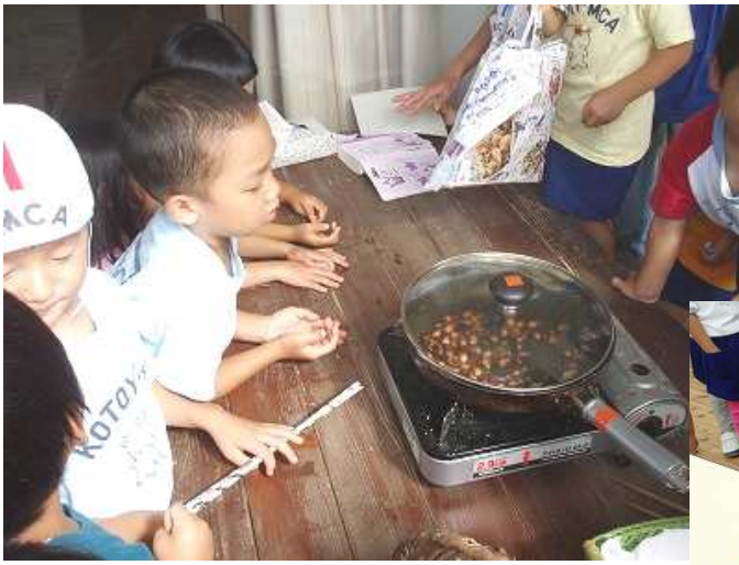
どんぐりの実、どんなお味かな？ ホクホクでおいしかったね。