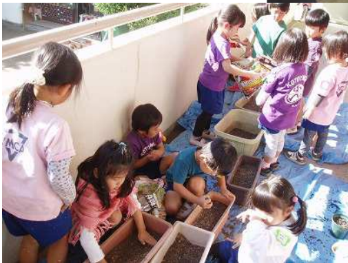
チューリップを植えるご用意 土をフカフカにしたよ。