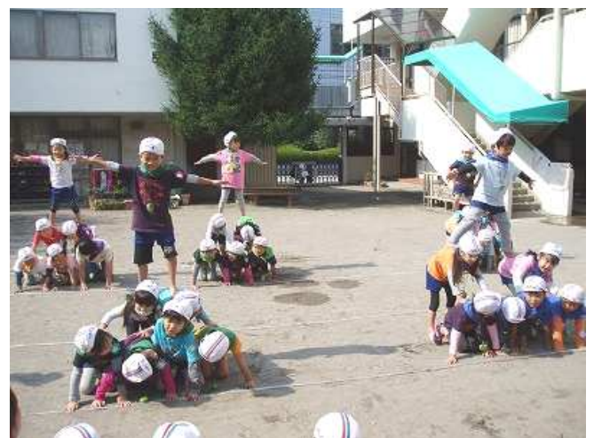
夏に行った森の思い出。 こんなにこんなにこんなに高いお山に登ったよ!!

年長組は電車に乗って「どんぐり拾い」にも 行って来ました。そして、子ども達から毎日の ように届く木の実や秋の草花。この季節にしか 感じることでできない恵みに嬉しく、楽しく、 そして神様に感謝をしてすごしてきました。