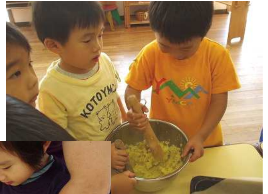
おやつで頂く スイートポテト 作ったよ!!