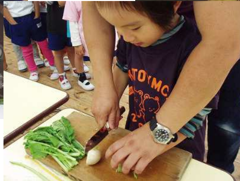
かぶスープ作り おいしくなあ〜れ!!