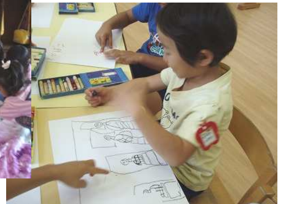
楽しかった運動会の絵を描いたよ。 「僕はとび箱、たくさん跳んだよ!!」

すっかり秋の季節。神様からの恵みをたくさん 感じた10月。皆の力をたくさん使った運動会。 大きなバスに乗って行ったおいも堀り!