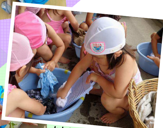
わたしは せんたくかあちゃん!