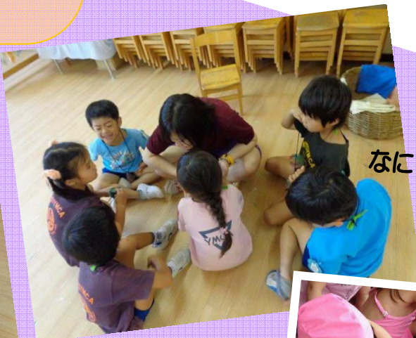
なにを相談しているの…?