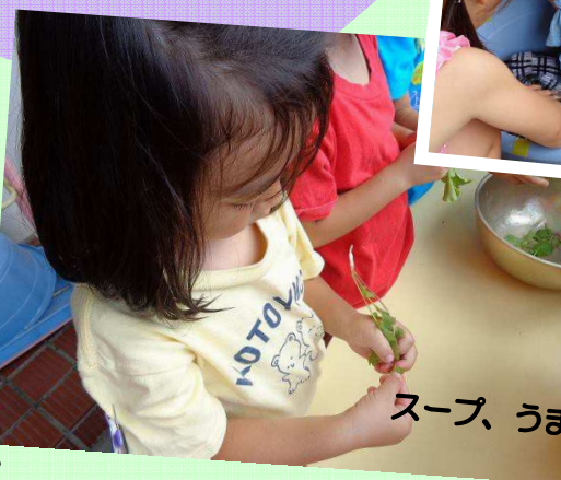
スープ、うま〜できるかなあ