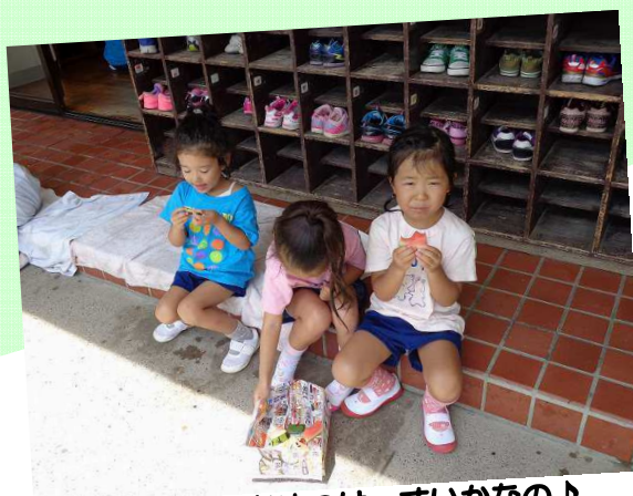
きょうのおやつは すいかなの♪