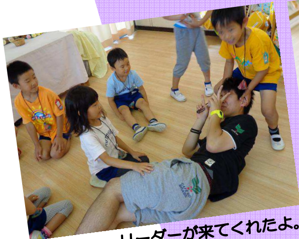
リーダーが来てくれたよ。