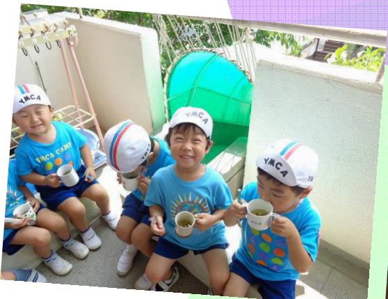
みんなで作ったやさいスープ、おいしい〜!