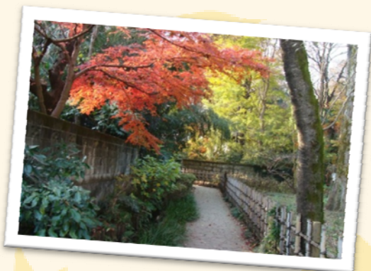
お鷹の道 道の名称は尾張徳川家のお鷹場だったのが由来。 虫が育つ清らかな湧水が流れています。