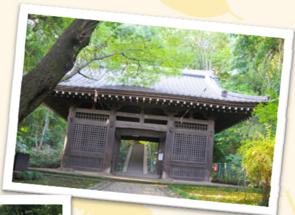
国分寺仁王門【市重要有形文化財】 木材の一部は建武2年(1335)のもの と伝えられています。