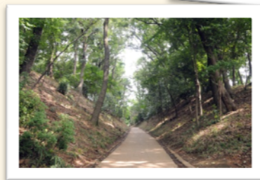
伝鎌倉街道 鎌倉時代に作られた、鎌倉と各地 を結ぶ道路のうちの一つ。木々の 緑でいっぱいです。