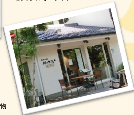
おたカフェ おいしいスイーツや飲み物 で休憩。国分寺グッズも 購入できます。