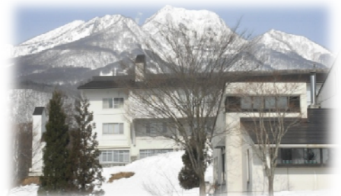
東京YMCA妙高高原ロッジは、国立公園内の森に囲まれた自然豊かなロッジです。温泉もお楽しみいただけます。

設備等：和室またはベッドルームを 1 家族（グループ） 1 室お使いいただけます。