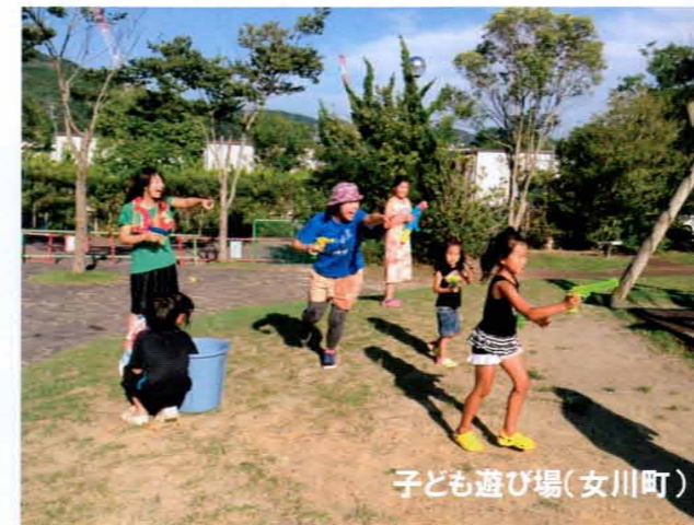
子ども遊び場(女川町)