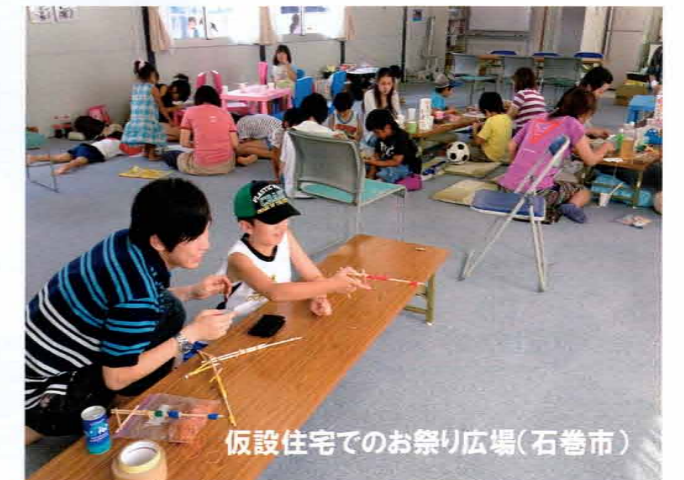
仮設住宅でのお祭り広場(石巻市)