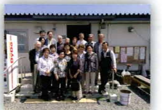
渡波地区の仮設団地自治会の皆さんと東京YMCA会員・石巻ツアー(6月)では震災当時の貴重なお話を伺いました

一方で、仮設住宅に引きこもりがちの方々も多くいるとも言われています。訪問したボランティアは「被災者が意外に元気だったので驚いた」とよく言いますが、私たちが交わっているのは、被災された方の中でも一部であることを忘れてはなりません。今後も地元と丁寧な関係を築き、共に震災を乗り越える活動を継続したいと思います。