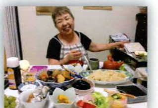
渡波地区の仮設に住むおばあちゃん 気づけば今夏10回以上もお邪魔しました

一方で、仮設住宅に引きこもりがちの方々も多くいるとも言われています。訪問したボランティアは「被災者が意外に元気だったので驚いた」とよく言いますが、私たちが交わっているのは、被災された方の中でも一部であることを忘れてはなりません。今後も地元と丁寧な関係を築き、共に震災を乗り越える活動を継続したいと思います。