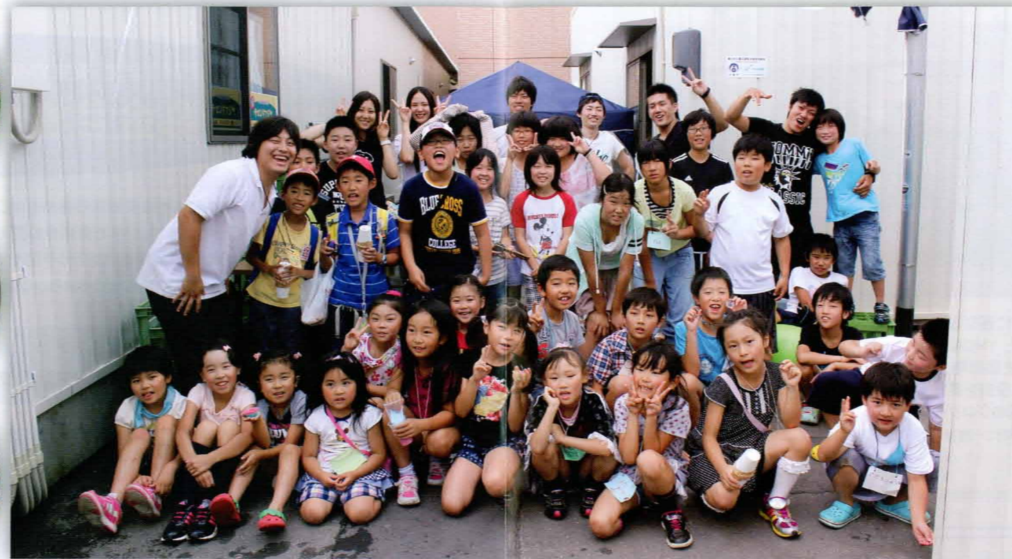
(夏休み「子ども学習支援プログラム」より)

WE BUILD STRONG KIDS, STRONG FAMILIES STRONG COMMUNITIES.