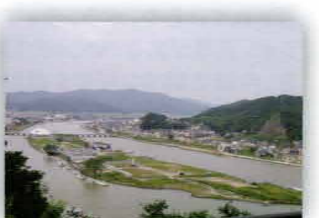
石巻市日和山より中瀬を臨む瓦礫は片付いたが、家が建つ気配はない

震災により多大の被害が出た石巻市沿岸部のガレキは、2013年度末をもって処分が完了する見込みです。しかし、震災による地盤沈下が甚だしく、人が再び住むために土地のかさ上げが必要な地域も少なくなく、地域によってはまだ7年間人が住めない状態が続くとされています。復興は長い道のりですが、それでも「ボランティアとの交流が生きがい」という地域の方々との関係も生まれてきました。YMCAが初期から支援を続けている渡波地区の仮設住宅に住む、おばあちゃん(写真)もその一人です。YMCAがその仮設団地で支援を行うと、必ずお宅に招いて下さいます。ある時は仮設の四畳半の部屋に10人以上で押しかけた事もありました。