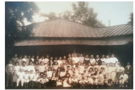
昔からの歴史が息づいています。 (1950年ごろのキャンプの写真です。)