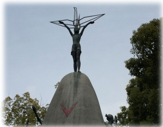
広島平和記念公園にある原爆の子の像(千羽鶴の塔)