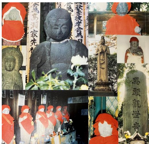
江東区の戦災慰霊碑「セノタフマップ」より