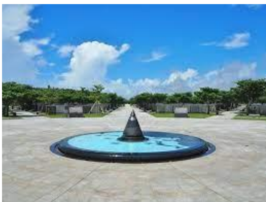
沖縄平和記念公園