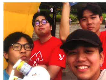
チャリティーラン