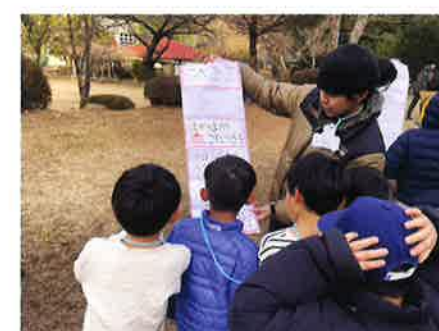
シーズンキャンプ