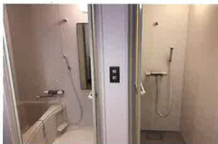
お風呂・シャワールーム

キッチンは、IHコンロや冷蔵庫、食器一式があります。一般的な調味料は、舎生全員で共同購入となります。