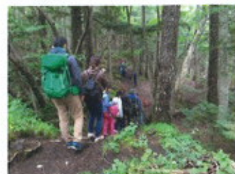
2015年9月のキャンプでは富士山5合目を散策しました

また上記リフレッシュキャンプの参加者を中心に、福島県郡山市で「わいわいキッズ 屋外子ども室内遊びプログラム」を継続的に実施しています。2015年7月11日に行った第7回目のプログラムには33名が参加、キャンプで出会ったお友達やリーダーたちとの再会を喜び、キャンプソングを歌ったとレクリエーションを楽しみました。