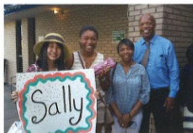
ホームステイ先家族と参加高校生